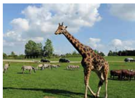
De meterhøje giraffer går frit rundt sammen med zebraerne.