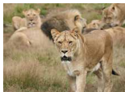
Bussen kører rundt blandt de farlige løver i GIVSKUD ZOO.

Verdens største dinosaur kan ses i GIVSKUD ZOO.