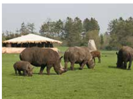
De tonstunge næsehorn kan tydeligt ses fra bussen.